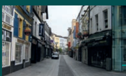
CORK 380.000 habitantes