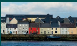
GALWAY 71.983 habitantes