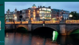
DUBLIN 1.661.185 habitantes