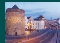
WATERFORD 45.775 habitantes

La superficie de la isla es de 84.421 km 2 , de los cuales un 83% pertenecen a la República de Irlanda y un 17% a la provincia británica de Irlanda del Norte. Como cualquier isla, está rodeada de agua, al oeste por el Océano Atlántico y al noreste por el Canal del Norte. Al este se encuentra el Mar de Irlanda.