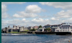
LIMERICK 93.321 habitantes